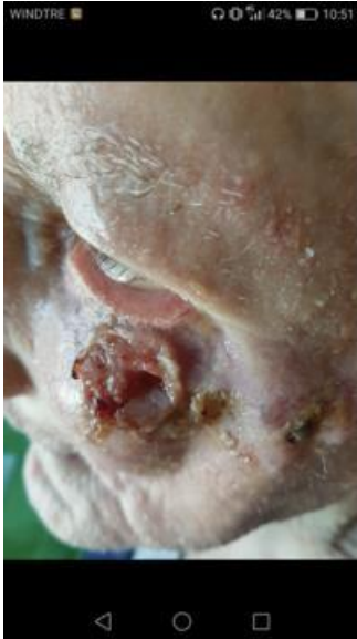
Valore di riferimento gennaio 2020